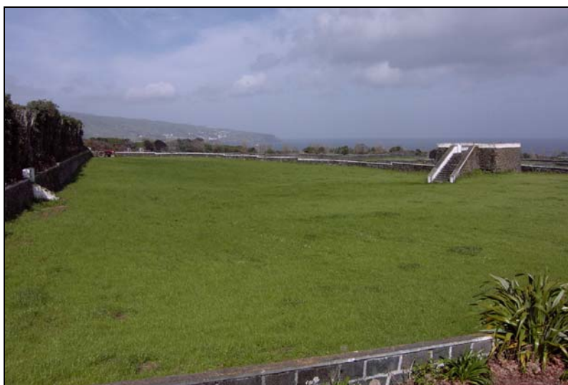
Estado actual em Março 2005 sem adubos desde 2003

Objecto do relatório: resultados da aplicação do Sistema Plocher nas pastagens com o intuito de reduzir ou abolir o uso de fertilizantes sintéticos melhorando a qualidade do solo e resistencia qualidade das ervas, e saúde das vacas leiteiras.