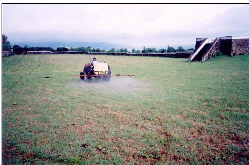
Aplicação em 2003 após corte